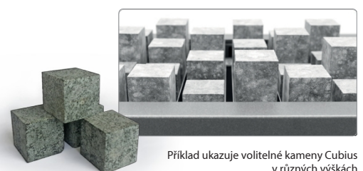
Příklad ukazuje volitelné kameny Cubius v různých výškách