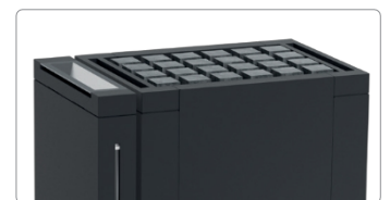
Mythos S45 antracit Vapor: Příklad ukazuje volitelný odpařovač a kameny Cubius