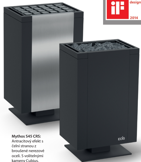
Mythos S45 CRS: Antracitový efekt s čelní stranou z broušené nerezové oceli. S volitelnými kameny Cubius.